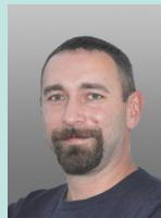
Robert Landl Programmänderungen & Updates